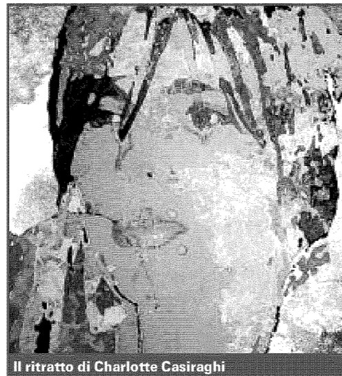
Il ritratto di Charlotte Casiraghi